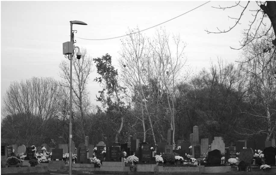
A helyi temető is biztonságosabb és világosabb lett

tomatikusan kapcsol a rendszer, mely az egész év folyamán 3900 óra világítást biztosít. A második beruházás a vidék-fejlesztési programból valósult meg, amely a kamerarendszer és a közvilágítás kiépítését tette lehetővé a sötét és rizikósabb helyekre. Így a községben 13 kamerát helyeztünk el és megvilágítottuk a temetőt, illetve a tópartot.