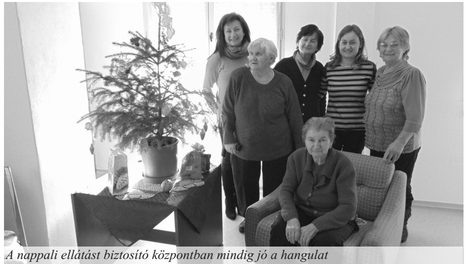
A nappali ellátást biztosító központban mindig jó a hangulat

• Már 2015 elejétől elkezdtünk azon dolgozni, hogy kiépítsük a testvértelepülési kapcsolatokat a környező országokban. Majd 2016 áprilisában az erdélyi Jedd községben alá is írtunk egy testvértelepülési szerződést a Jedd-i, a magyarországi Kamond és a kárpátaljai Palágykomoróc települések vezetőivel „Négy ország, egy nemzet” szlogennel. A szerződés lényege a magyarságunk, illetve az identitásunk megőrzése a fő cél. Ez a kapcsolat most már ott tart, hogy rengeteg barátság alakult ki a lakosok között is, akik az internetnek köszönhetően szinte naponta kommunikálnak egymással, vagy elutaznak egymáshoz. Ennek a szerződésnek a hozama volt már a 2017 júliusában megrendezett többnapos testvértelepülési találkozó, amire Szapon került sor. Ennek folytatása egy erdélyi visszahívás volt, ahova egy busznyai szapi látogatott el. Mivel a magyarországi Kamond község közelebb van, hamarabb tudunk barátságos focimérkőzéseket szervezni, vagy csak úgy találkozni.