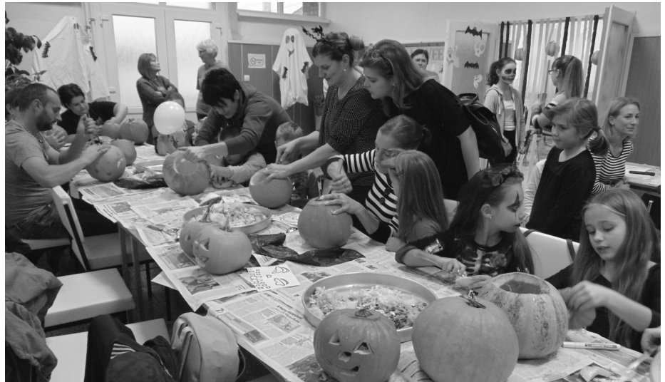
Gyerekek és szülei együtt faragták a lámpásokat

Miután mindenki elkészítette a tök-lámpását, sötétedéskor mécseset helyeztek bele, majd a kultúrház bejáratánál állították ki őket. Ezután a gyerekek legnagyobb örömeire elkezdődött a Halloween party, ahol különböző játékokban vehettek részt. A kultúrházban igazi diszkó-hangulat uralkodott, ahol vonatozás, széktánc, seprútánc is volt. A szer-