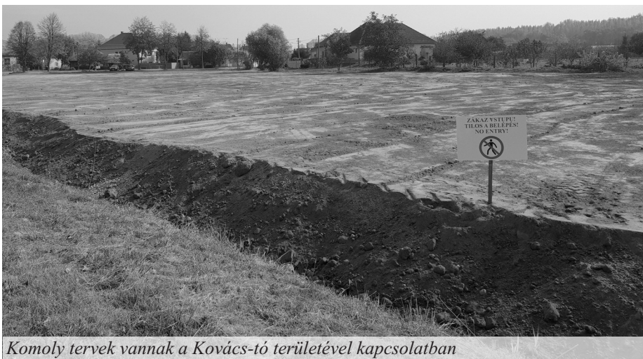
Komoly tervek vannak a Kovács-tó területével kapcsolatban

• Az első ilyen a közvilágítás felújítása volt, amelyre már nagyon ráért a korszerűsítés. Új ledes lámpatesteket szereltünk fel új lámpatartókra és az elosztószekrény is ki lett cserélve. Így au-