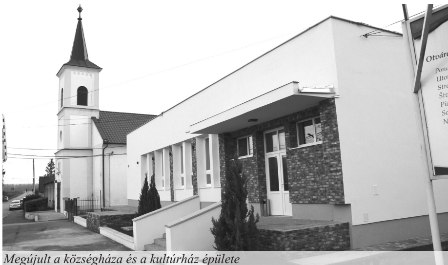
Megújult a községháza és a kultúrház épülete

A hivatalba lépő polgármesterek általában nagy tervekkel érkeznek, aztán arcon csapja őket a realitás. Hogy lehet ezt a kettőt összeegyeztetni?