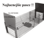
Najlacnejšie pasce !!