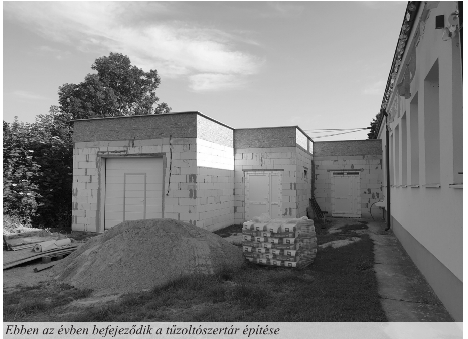
Ebben az évben befejeződik a tűzoltószertár építése

Szinte az összes községi rendezvényünket a szervezetekkel karöltve pályázati források segítségével valósítottunk meg. A 2019-es évben is kihasználtuk a közmunka- és az ápoló-programot, amivel többségében helyi lakosoknak tudtunk munkát biztosítani a településen. Pályázati forrásból sikerült egy új tűzoltószertárat építeni, aminek van egy felszerelt konyhája, öltözője, illemhelyisége, raktára, valamint egy nagy garázs. Ebben a garázsban parkol az új, modern felszereltségű IVECO DAILY tűzoltóautónk. Az épület külső homlokzatát ebben az évben, tehát 2020-ban fejezzük be. Erre az anyagiakat már biztosítottuk. Az öreg tűzoltószertár ezzel felszabadul, aminek átalakítására már elkészítettük a tervrajzokat. Itt egy szolgáltatásokat biztosító épület kap majd helyet. Most a megfelelő pályázati kiírást várjuk, hogy meg is tudjuk ezt valósítani.