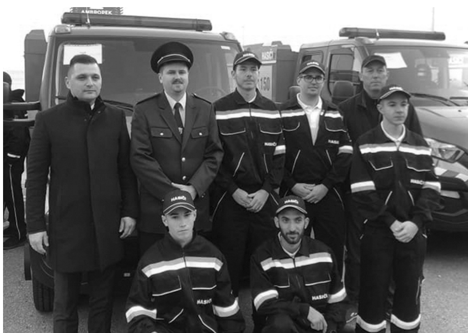
Önkéntes tűzoltóink novemberben vették át az új tűzoltóautót

Ahogy az elmúlt évek és évtizedek egyike se volt könnyű, úgy a 2019-es évtől sem várhattuk, hogy egyszerűbbé teszi az önkormányzatunk életét. A mindennapi teendők, mint a községi hivatal működtetése, az államtól átruházott hatáskörök elvégzése, épületeink és közterületeink karbantartása, illetve fenntartása mellett nagy hangsúlyt kell fektetni a település szervezeteire, valamint az ingatlanok fejlesztéseire. A pénzforrás hiánya sokszor nem engedi az adott községet úgy fejlődni, ahogy azt az itt élő