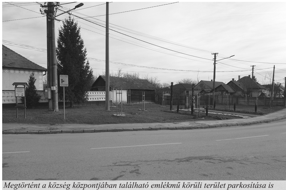
Megtörtént a község központjában található emlékmű körüli terület parkosítása is