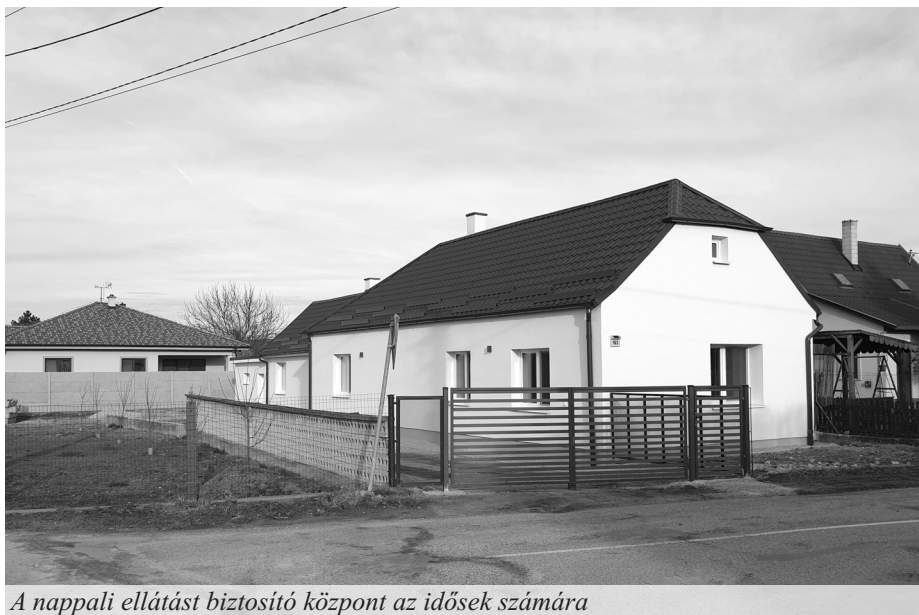
A nappali ellátást biztosító központ az idősek számára

gedélyezési eljárás során az egyik résztvevő megtámadta az engedély jogerőségét, ezért a felsőbb szervek utasítására új engedélyt kell kiadnia a községnek. Ez időben eléggé meghosszabbítja az egész folyamatot. Ha ez nem történik meg, akkor ma már 4 család lakhatna ezekben az új lakásokban.