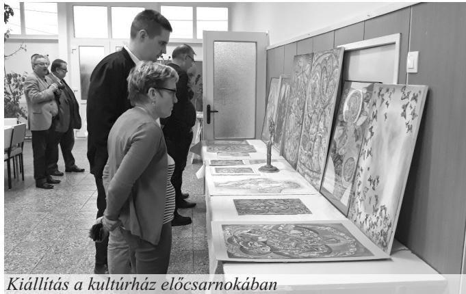
Kiállítás a kultúrház előcsarnokában