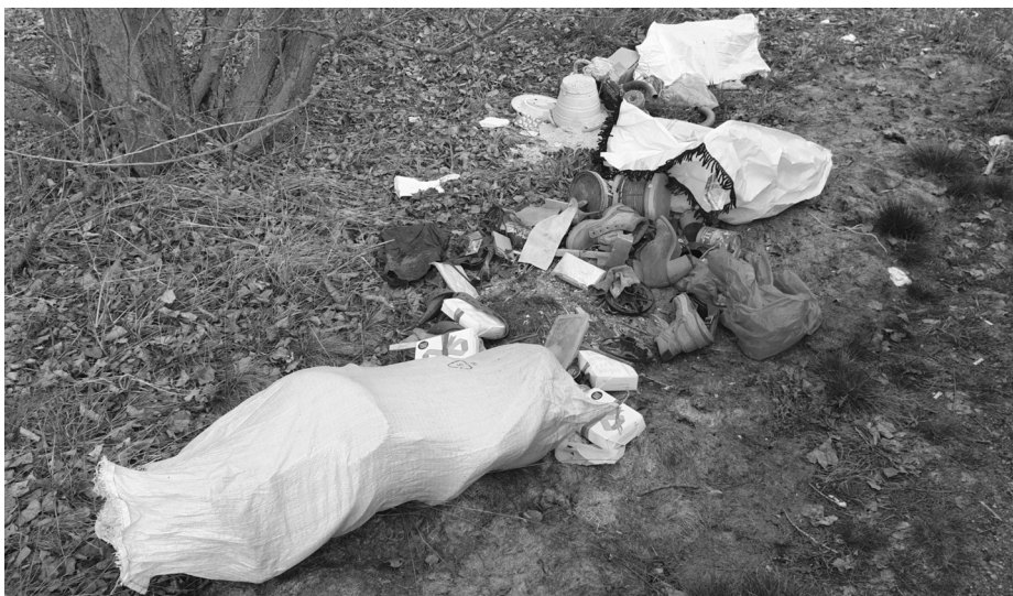
Lomtalánítás után azonnal felbukkantak a szemetelők

A hulladék osztályozásának lényege, hogy minél többen és hatékonyabban