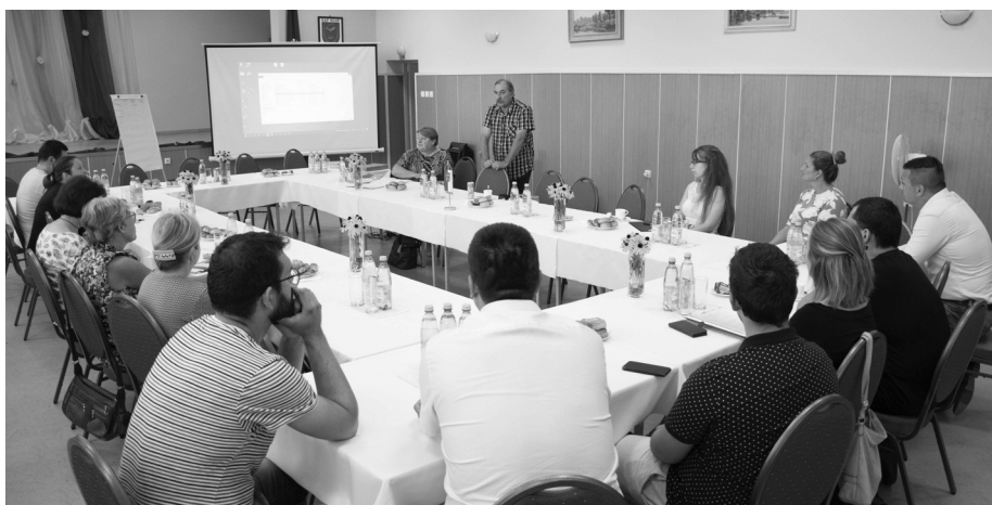
A szapi értékek bemutatása 2021. augusztus 2-án került megrendezésre

A nemzeti értékek adatait a települési értéktárban az egyes szakterületenkénti kategóriák szerint azonosítja és rendszerezi a beérkezett javaslatok alapján a bizottság, melyet bárki írásban kezdeményezhet az adott érték fellelhetőségének helye szerint a meghatározott formanyomtatványok kitöltésével. Ilyen módon községünk értékei és hagyományai egy nagyobb egész részévé válnak.