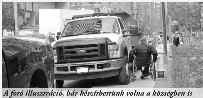
A fotó illusztráció, bár készíthettünk volna a községben is

Komolyabb gondot okoznak az autóparkolások. Természetesen nincs azzal gond, ha valaki hazaugrik ebédelni és arra a fél órára a háza előtt, a járdán hagyja az autóját, a probléma ott kezdődik, ha napokig kint áll a kocs. Nagyon sok családi háznál van garázs, de ha mégsem, az udvarra mindenki be tud állni az autóval. A járdán való parkolásnak számos hátránya van, természetesen nem a sofőrökre nézve... A kerékpárosok nem tudják biztonságosan kikerülni az útra félig belógó kocsikat, a járdákat elfoglaló gép-