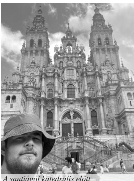
A santiágói katedrális előtt

...és még plusz százat, ami Santiagóban, az óceánnál ér véget. Saint-Jean Pierre de Port-ból, Franciaországból indultam, onnan sétáltam vissza Spanyolországba, Pemplonán keresztül, láttam a legszebb városokat, nagyon gyönyörű volt. Ez is tartotta bennem az erőt, mert azért elég nehéz út volt. Ez javarészt egy önismereti túra, ezért is vágtam neki egyedül. Sokan sétálnak csoportban, de ők nem tudnak elmélyedni, magukba nézni, ami az egyik lényege lenne. Aztán voltak olyanok, akik ugyanúgy egyedül mentek, velük beszélgettem egy órát, másfelet, aztán