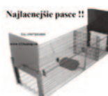
Najlacnejšie pasce !!