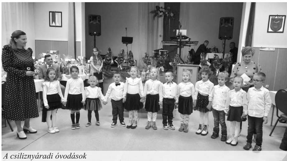
A csiliznyáradai óvodások