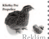
Klietky Pre Prepelice