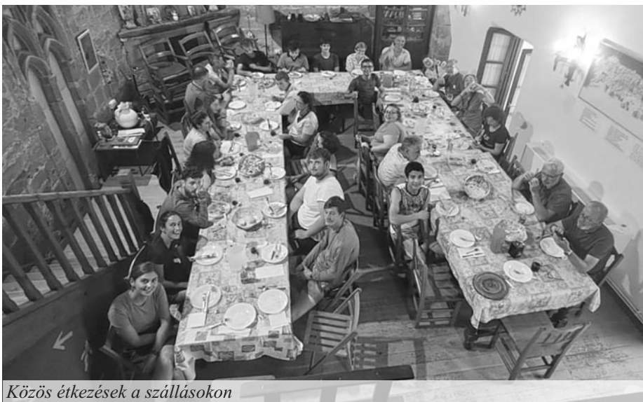
Közös étkezések a szállásokon

Vérzett, és bizony volt fertőzésveszély is. Gyilkolni tudtam volna a szememmel, annyira fájt. Ráadásul tartalékcipővel nem is készültem. Volt aki azt mondta, menjek el orvoshoz, de gondoltam, nem ismertek ti engem, én szapi gyerek vagyok.