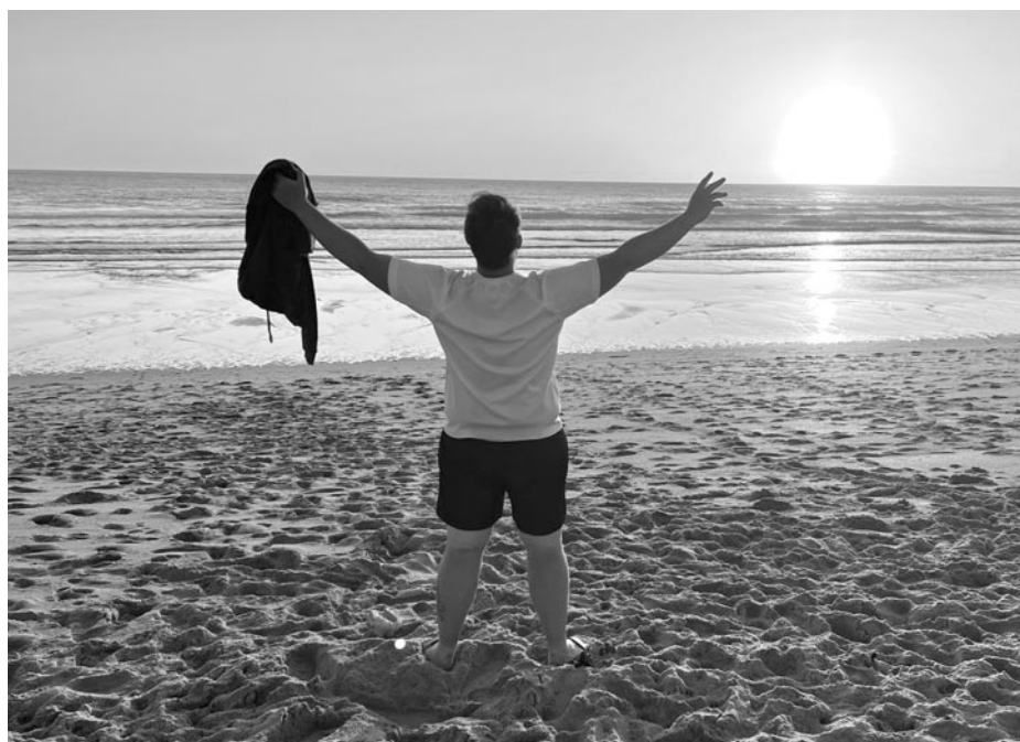
Finisterra, amiről egykor azt hitték, hogy a világ vége