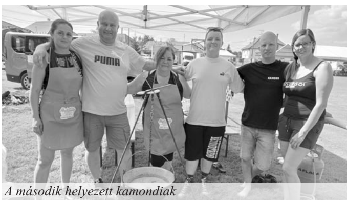
A második helyezett kamondiak