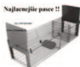
Najlaenejše pasce !!