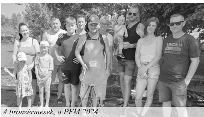
A bronzérmesek, a PFM 2024

Asbóth Szabolcstól: „Szeretném megköszönni testvértelepülésünk, Szap Község Önkormányzatának és Miklós Ferenc polgármester úrnak a meghívást a település új játszóterének átadására. Mindig nagy élmény visszatérni e vendégszerető községbe. Az ember életében kevés olyan alkalom van, amikor olyan hatalmas meglepetés éri, hogy tényleg elakad a szó. Ez tegnap sikerült! Októberben leköszönő polgármesterként az a megtiszteltetés ért, hogy átvehettem Szap Község Önkormányzatától egy emléklakettet, amelyen az alábbi felirat olvasható: