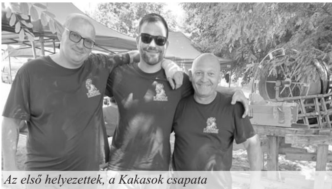
Az első helyezettek, a Kakasok csapata