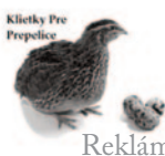
Klietky Pre Prepelice