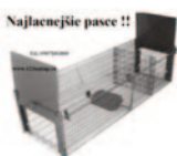
Najlaenejšie pasce !!