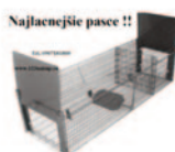
Najlaenejte pasce !!