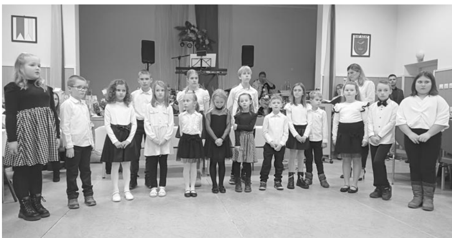
A Csilizradványi Kóczán Mór alapkola szapi tanulói

Külön köszönet illeti a helyi magán-személyeket, az önkormányzati dolgozókat és mindazokat, akik munkájukkal hozzájárultak a rendezvény sikeréhez. A szépen megterített ünnepi asztal, a