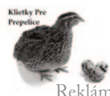
Klietky Pre Prepelice