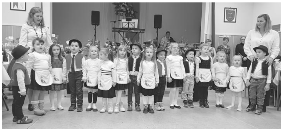
A csiliznyáradai óvodások

A beszámoló során részletesen ismertették a szervezet tevékenységeit. Az év folyamán számos programot, kirándulást és ünnepséget szerveztek, amelyek a tagok mindennapjait tették színesebbé.