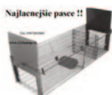
Najlacnejšie pasce !!