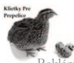
Klietky Pre Prepelice